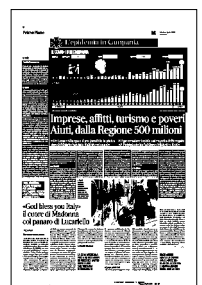
Peso: 1-7%, 6-52%